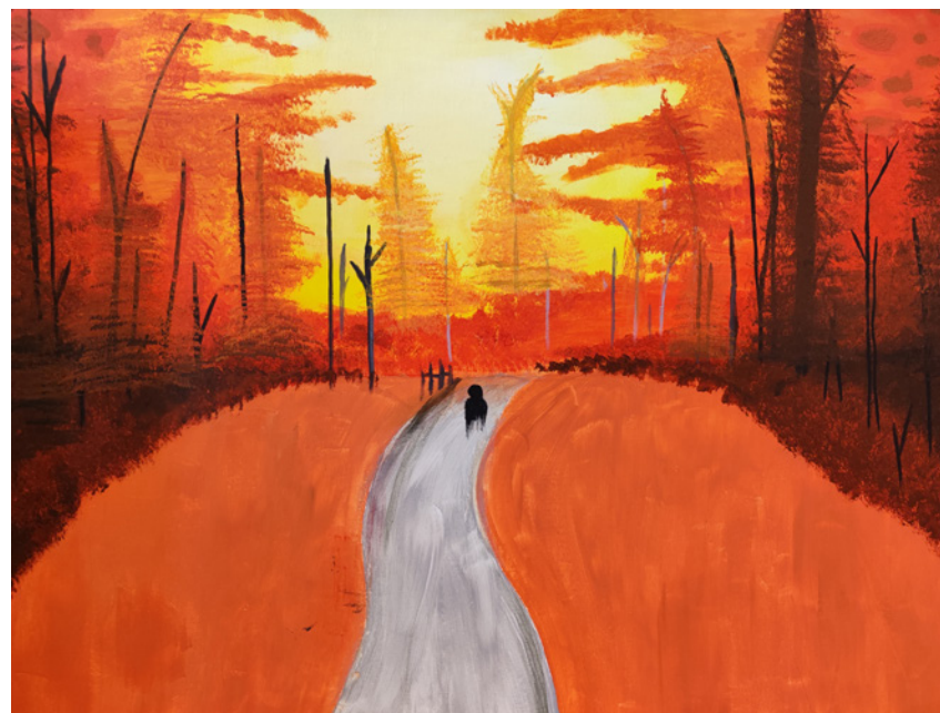
Noëlle van Woerden, leerling Curio Scala