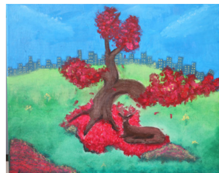
Eke, leerling De Kei