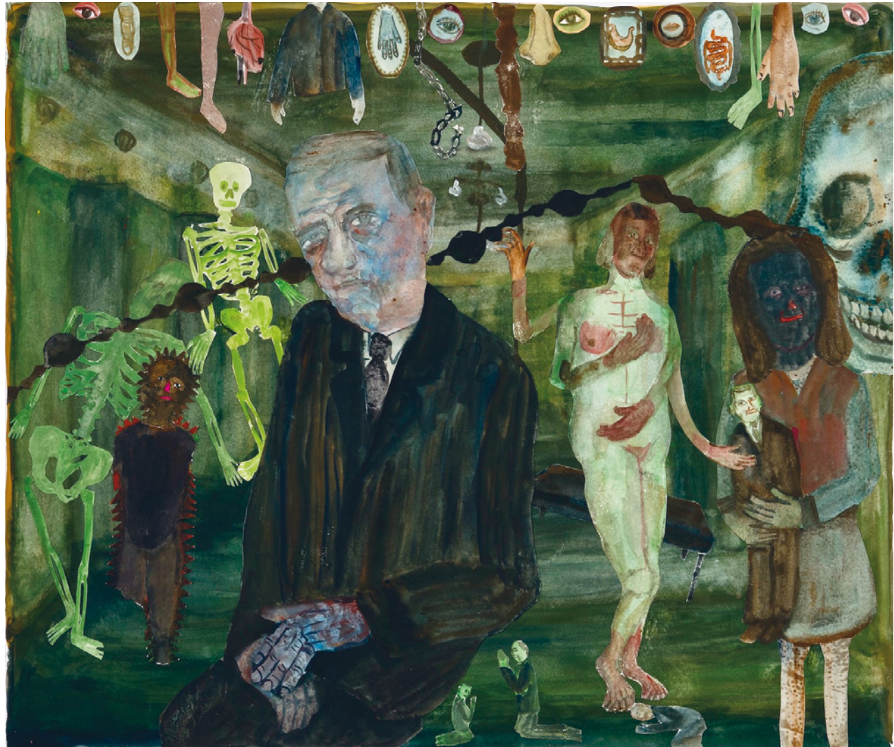
Marenne Welten, Double take , gouache collage op papier 2021