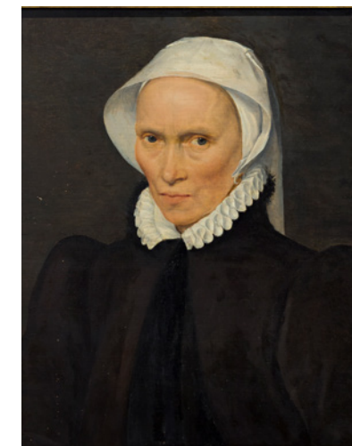
Willem Key, Portret van een onbekende vrouw, Z.D.

Anoniem Z.D. Handplooier, Plooiblok, Plooitang Museum van Brabantse Mutsen en Poffers